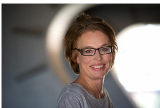
Silke Vry ©privat

Optische Täuschungen sind spannend! Sie zeigen: Unseren Augen ist oft nicht zu trauen und man sollte nicht alles glauben, was man sieht. Du kannst einige der faszinierendsten und erstaunlichsten optischen Illusionen selbst bauen, zum Beispiel schwebende Würfel und Drachen, die einen nicht mehr aus den Augen lassen.